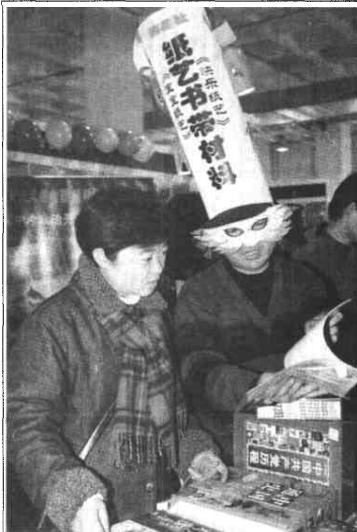
1月10日,2002年北京图书订货会在中国国际展览中心开幕。来自全国各地的近500家出版社的精品图书在本届图书订货会上亮相。这是我国加入世贸组织后的第一个大型图书订货会。这是一家参展出版社的工作人员为引人注目戴着“广告高帽”卖书。

据新华社北京1月10日电 (记者 赵承) 2002年我国将全面启动退耕还林工程。国家计委有关负责人今天在此间表示,今年计划退耕还林面积3400万亩,宜林荒山荒地造林面积3993万亩。 据介绍,在总结两年试点的基础上,今年将抓住目前粮食库存较多的有利时机,加快实行“退耕还林、开仓济贫”。要采取个体承包的方式,做到“三到户”,即退耕还林和宜林荒山荒地造林,以及植被保护的义务落实到户;国家粮食补助、现金补助和种苗补助的政策兑现到户;实行“谁造林(草)谁经营、谁受益”的政策,林草权属落实到户。 为了保证退耕还林任务的完成,今年将落实退耕还林“目标、任务、资金、粮食、责任”五到省的规定,落实市、县、乡级政府目标责任制,项目管理和技术承包责任制,各部门分工负责制;科学编制县级实施方案和乡镇级作业设计工作,将任务、措施落实到山头地块,落实到农户。同时,要做好种苗准备,确保种苗供应。加强监督检查,严格补助粮和补助资金的管理。