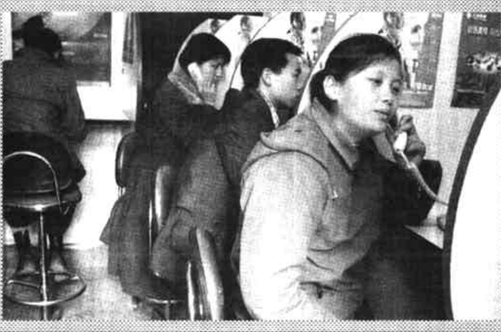
「电话吧」在南昌悄然出现

新华社北京1月10日电 (记者 赵承) 国家计委有关人士近日说,铁路运价属于《价格法》规定的自然垄断经营的商品和服务价格,而不是有些人认为的那样属于公益价格。 这位人士解释说,《铁路法》明确铁路运输是企业性质,国家对铁路行业也是按照企业性质进行管理,对铁路运输行业有明确的盈亏考核指标的。当前,根据国务院的部署,铁路行业正按照政企分开、独立核算、自负盈亏方向进行企业化改革。改革后,铁路运输企业将按照市场经济体制要求,建立现代企业制度。铁路运价也应根据运输成本、供求关系的变化按照市场规律来形成。虽然铁路运输具有准公用产品的特征,甚至现在还承担着一些政策性的运输和公益运输义务,但它仍然属于《价格法》规定的自然垄断经营的商品和服务价格。 据介绍,虽然国家计委颁布的听证目录只规定了“铁路旅客运输基准票价率”要实行听证,但基准票价率是由各种列车、席别的票价综合加权平均而计算出来的,如特快列车、普快列车的票价,新型空调车和老式车型的票价,以及同一车型中软卧、硬卧、硬座的票价等。对部分旅客列车实行政府指导价之后,由于各种车型票价的变化,必然要影响基准票价的变化。基准票价与部分旅客列车票价实行政府指导价之间有互动、互相影响的因果关系。因此部分旅客列车票价铁路价格实行指导价方案,必须进行价格听证会。