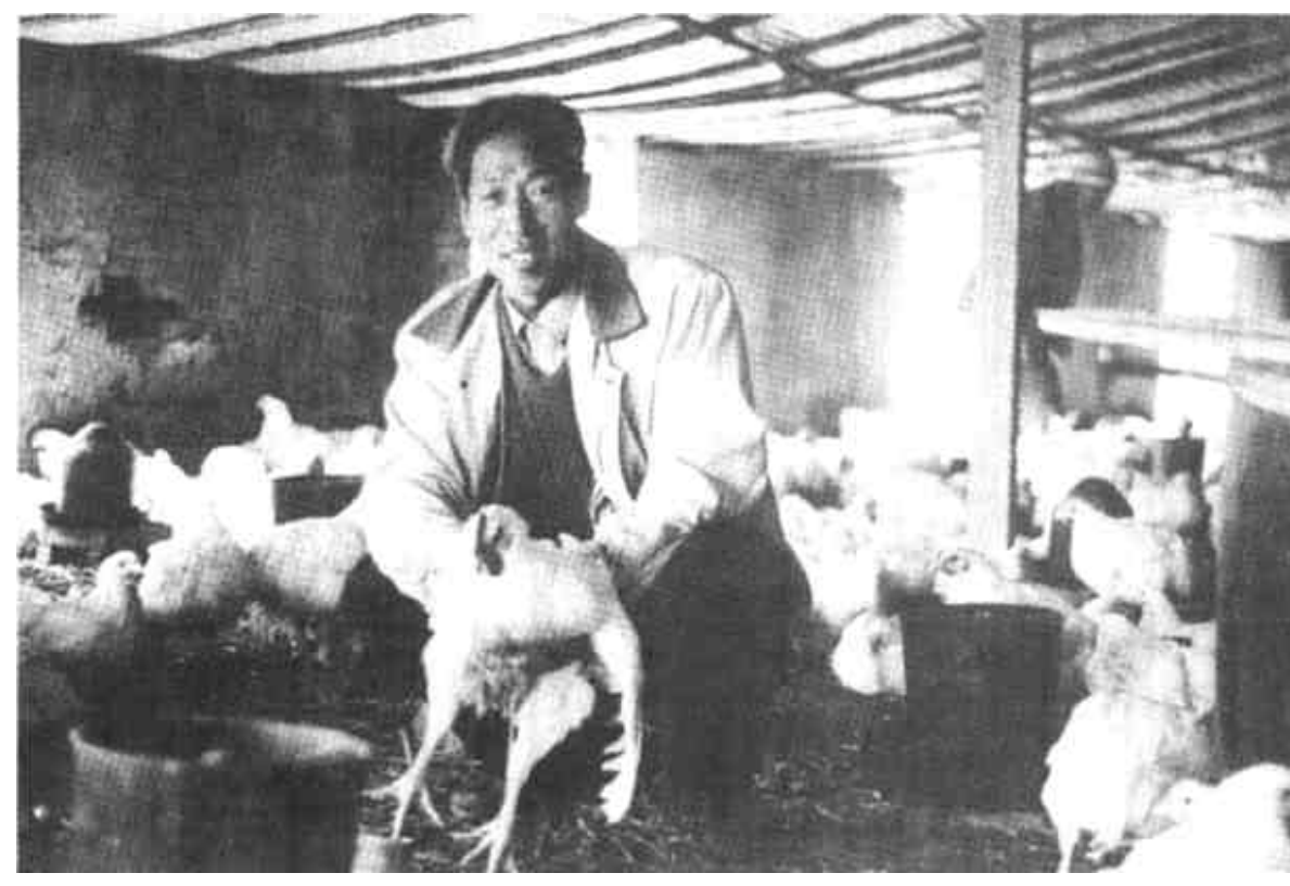
东营区龙居乡为增加群众收入，积极与加工企业联系，引导农民签订养殖订单，受到群众欢迎。

设施。 韩宝光就烟花爆竹、危险化学品管理强调，要严格烟花爆竹生产经营审批，对不符合安全生产条件的企业，严禁发放生产许可证和经营许可证，尽快组织一次全面检查，发现有违章行为或存在重大隐患的，要坚决责令停止生产经营。运输易燃易爆和剧毒品的车辆，必须取得许可证，并进行严格检测检验，加强对生产危险化学品物品的设备、管道的监护，防止泄火、火灾、爆炸和中毒事故。(记者 蔡文龙)